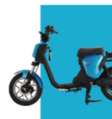
Xanh thiên thanh