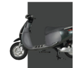
Ghi bóng/Ghi sần