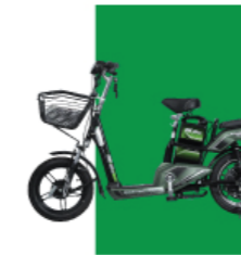
Xanh lá cây