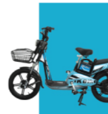
Xanh thiên thanh