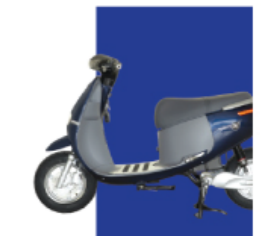
Xanh cửu long