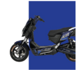
Xanh cứu long