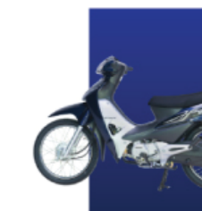
Xanh cứu long