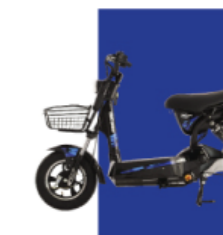
Xanh cừu long