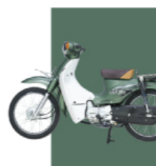
Xanh lá cây