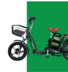
Xanh lá cây