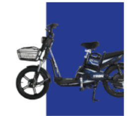
Xanh cừ long