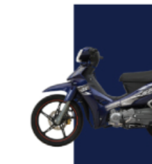
Xanh Cửu Long