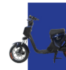
Xanh cừu long