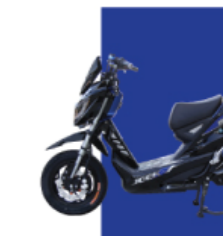
Xanh cứu long