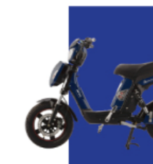
Xanh cửu long