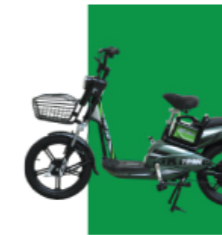
Xanh lá cây