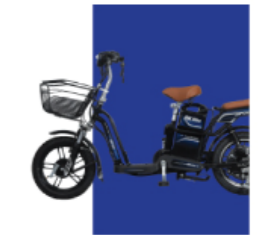
Xanh cừ long