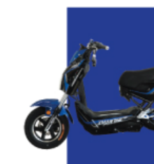
Xanh cửu long