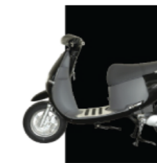
Đen bóng/ Đen sần