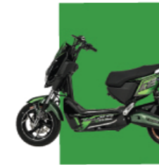
Xanh lá cây