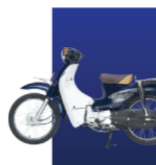
Xanh cửu long