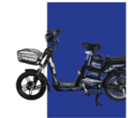
Xanh cừ long